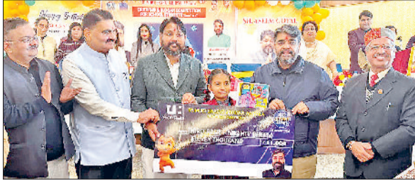
अंबाला। प्रतियोगिता के विजेता छात्रों को सम्मानित करते मुख्यअतिथि हुए।