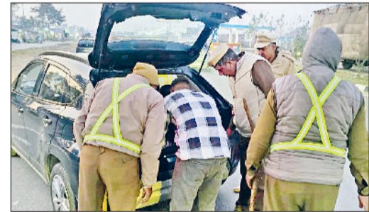
पानीपत। उत्तर प्रदेश की ओर से आ रही कार की तलाश लेते पुलिस टीम।