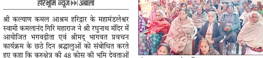
हरिभूमि न्यूज अंबाला। प्रवचन सुनते उपस्थित श्रद्धालु।