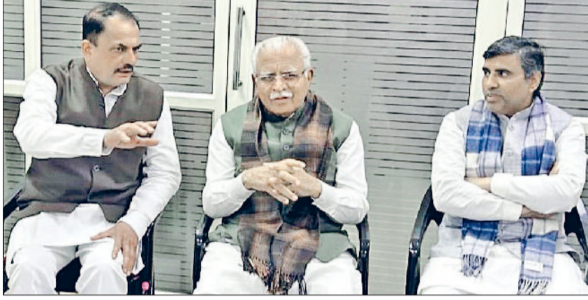
पानीपत। गांव सिवाह में केंद्रीय मंत्री मनोहरलाल ग्रामीणों से बातचीत करते हुए व साथ में है प्रदेश के शिक्षा मंत्री महीपाल ढांडा।

केंद्रीय मंत्री मनोहरलाल का ग्रामीणों ने बुके देकर स्वागत किया