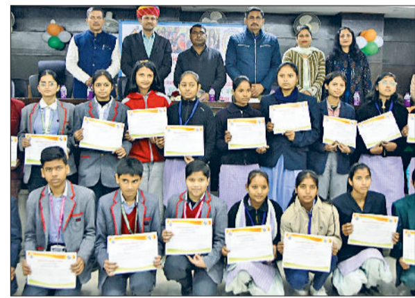
पानीपत। राष्ट्रीय मतदान दिवस समारोह में पुरस्कृत विद्यार्थी आदि।