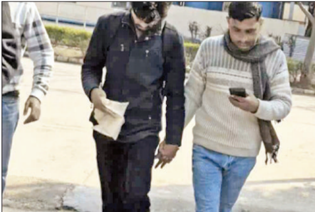
करनाल। मेडिकल कॉलेज के हॉस्टल से अपने साथ पकड़कर ले जाती राजस्थान पुलिस।