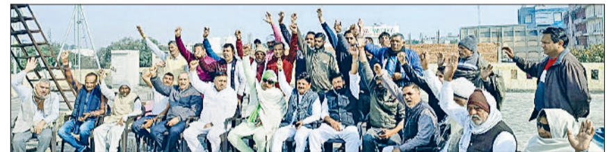
पानीपत। बैठक करते हुए स्वर्ण समाज के प्रतिनिधि।

करता है, इसलिए हर नागरिक को अपने मताधिकार का अवश्य प्रयोग करना चाहिए। उन्होंने कहा कि अच्छे व सकारात्मक परिणामों के लिए मतदान बेहद जरूरी है तथा लोकतंत्र की मजबूती के लिए दूसरों को भी मतदान के लिए प्रेरित करना होगा। वहीं, भारतीय निर्वाचन आयोग ने चुनाव को निष्पक्ष, पारदर्शी और सुलभ बनाने के लिए कई महत्वपूर्ण कदम उठाए हैं।