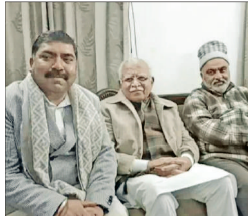
करनाल। मीडिया से बातचीत करते केंद्रीय मंत्री मनोहर लाल।

केंद्रीय मंत्री मनोहर लाल खट्टर देर रात करनाल में पहुंचे। सुबह उन्होंने मीडिया से बातचीत करते हुए संगठन, विकास योजनाओं, केंद्र-राज्य समन्वय, विपक्षी बयानों और राष्ट्रीय युद्धों पर खुलकर अपनी राय रखी। मंत्री ने गणतंत्र दिवस की अग्रिम शुभकामनाएं देते हुए कहा कि सरकार का फोकस विकास, युवाओं को आगे बढ़ाने और लंबित परियोजनाओं को गति देने पर है। केंद्रीय मंत्री ने दिल्ली से करनाल तक रैपिड ट्रेन परियोजना पर कहा कि दिल्ली से करनाल तक रैपिड ट्रेन चलना तय हो चुका है। जल्द ही इसकी डीपीआर तैयार की जाएगी और उसके बाद कैबिनेट से मंजूरी ली जाएगी।